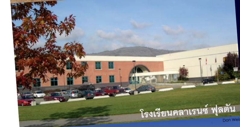
โรงเรียนคลาเรนซ์ ฟูลตัน