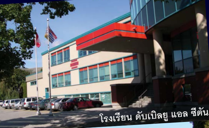
โรงเรียน ดับเบิลยู แอล ซีตัน