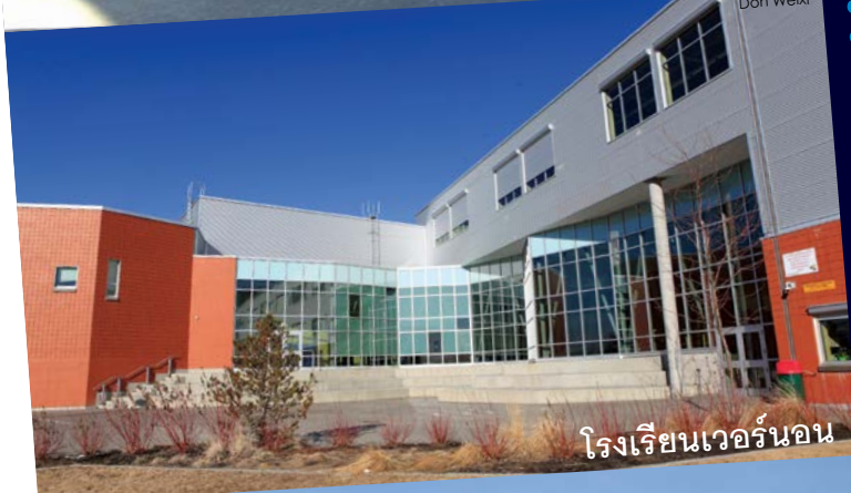
โรงเรียนเวอร์นอน