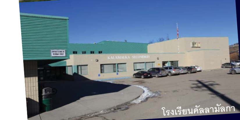
โรงเรียนคัลลามักกา

เรียนรู้ มาสัมผัสกับประสบการณ์ที่ได้รับผลประโยชน์