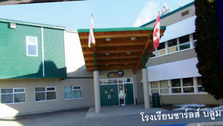
โรงเรียนชาร์ลส์ บลูม